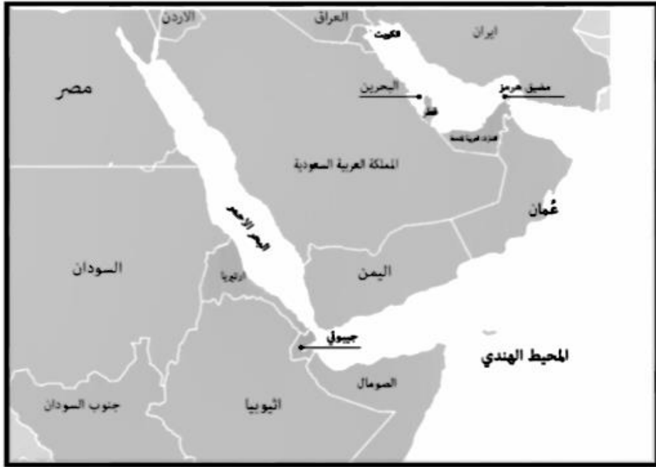
الشكل رقم (1): الموقع الجغرافي للجمهورية اليمنية

وترجع أهمية اليمن السياسية إلى موقعه الجغرافي المميز حيث يضاف إلى جانب إشرافه على البحر الاحمر ميزة التحكم في مدخله من الجنوب، وقربه من جزيرة "بريم" التي تتحكم في مضيق باب المنذب، علاوةً على ما يضيفه موقعه من الواجهة القريبة لأفريقيا الشرقية والمحيط الهندي والسعودية وكل البلاد الواقعة على البحر الاحمر، ولكونه غنياً بالثروة البترولية والمعادن التي ثبت وجودها. كما تشير الأدلة "الاركيولوجية" (Archaeology) 1 إلى أن اليمن وخصوصاً مدينة عدن كانت في العصور الحجرية قديماً مأهولة بالسكان حيث انتقل قسم منهم إلى عُمان ومناطق الخليج العربي الأخرى وإلى شبه جزيرة سيناء وفلسطين والاردن والبعض عبروا مضيق باب المنذب باتجاه الصومال وكينيا وتانزانيا (Al-Asbahi, 2005). والشكل التالي يوضح الموقع الجغرافي لليمن والدول المحيطة بها: