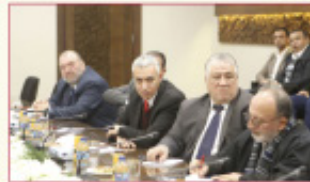
عزّاز - يوقون يوم الثاني: النقاشية في جامعة الشرق الأوسط

تمكن الرئيس في وقت واحد وفق ناصر الدين موقف يعلق بلا حيلة ما لم يكن على إقرار الصفقة والصفحة لتفكيك من مرحلة عدم القبول التصبر عنه والتخطيط والابتزاز الأيسر النجحة أسبقاً الرئيس وفق مبررات قانونية وتصريحات تشبه وأجرباً علمية والدينية. مستبعد بها جميع الحقوق التي تتكررها الصفقة.