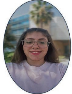
Talar Qsous UI/UX